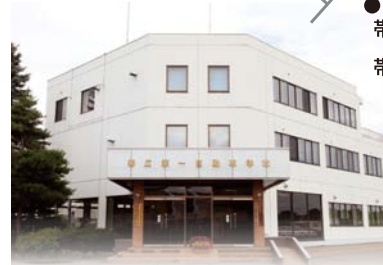
北海道釧路方面公安委員会指定